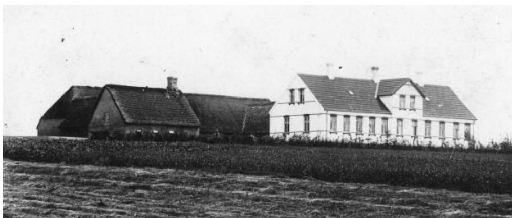
Bakgården med det nye stuehus, som blev bygget sommeren 1910